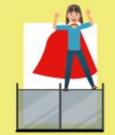
Благодарим ви! Bulgare