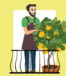
Go raibh míle maith agat! Irlandais